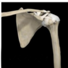
Een versleten schoudergewricht

Het kraakbeen kan na verloop van tijd slijtage gaan vertonen. Deze aandoening wordt artrose genoemd. Als het kraakbeen versleten is kan het gewricht niet meer soepel bewegen en veroorzaakt het pijn en stijfheid.