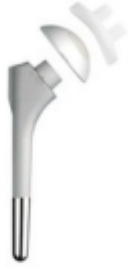
Totale schouderprothese (met lange steel)